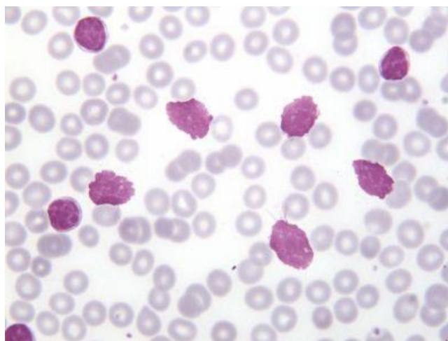
Imagen 3. Muestra de sangre periférica de un paciente afecto de leucemia linfática crónica de morfología típica. Se identifican linfocitos de tamaño pequeño con citoplasma escaso, núcleos de contorno liso con la cromatina condensada en caparazón de tortuga, sin nucleolo visible. Se visualizan, del mismo modo, abundantes sombras de Gumprecht Navarro, JT. Leucemia Linfática Crónica. [Internet]. Atlas.gechem.org. 2020.

LLC típica: La forma típica, también llamada variante "clásica" es la forma más frecuente de presentación de la LLC supone la 3ª parte de las LLC diagnosticadas. En este tipo el 90% de los linfocitos son de talla pequeña, con un volumen medio de 211,5 \pm 32,5 fL, presentan un núcleo con cromatina agrupada en varios grumos, separados por